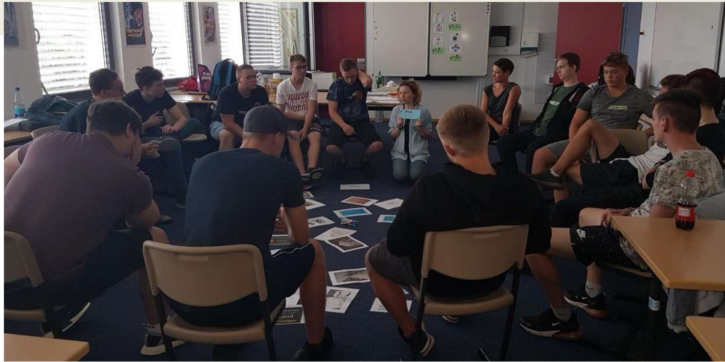
Die Modellklasse SHK 91 bei der Einführung des Klassenrates durch den DEVI e.V. (Verein für Demokratie und Vielfalt e.V.) am 08. August 2019 am OSZ TT

Das Entwicklungsteam, dazu gehören die Lehrkräfte Astrid Halte, Kathrin Kahmann, Katinka Steinhöfel, etabliert im Rahmen des Projektes „Gemeinsam zum Ziel“ inklusive Strukturen am Oberstufenzentrum Technik Teltow (OSZ TT). Unter dem Motto „Fördern und Fordern – Auf dem Weg zum inklusiven Oberstufenzentrum“ wurden im vergangenen Schuljahr Maßnahmen geplant, die in diesem Schuljahr umgesetzt und fortwährend verbessert werden sollen. Unterstützt wird das Projekt durch die Schulleitung des OSZ TT, den Landkreis Potsdam Mittelmark sowie die sonderpädagogische Förder- und Beratungsstelle Teltow. Die wissenschaftliche Begleitung erfolgt durch die Technische Universität Berlin.